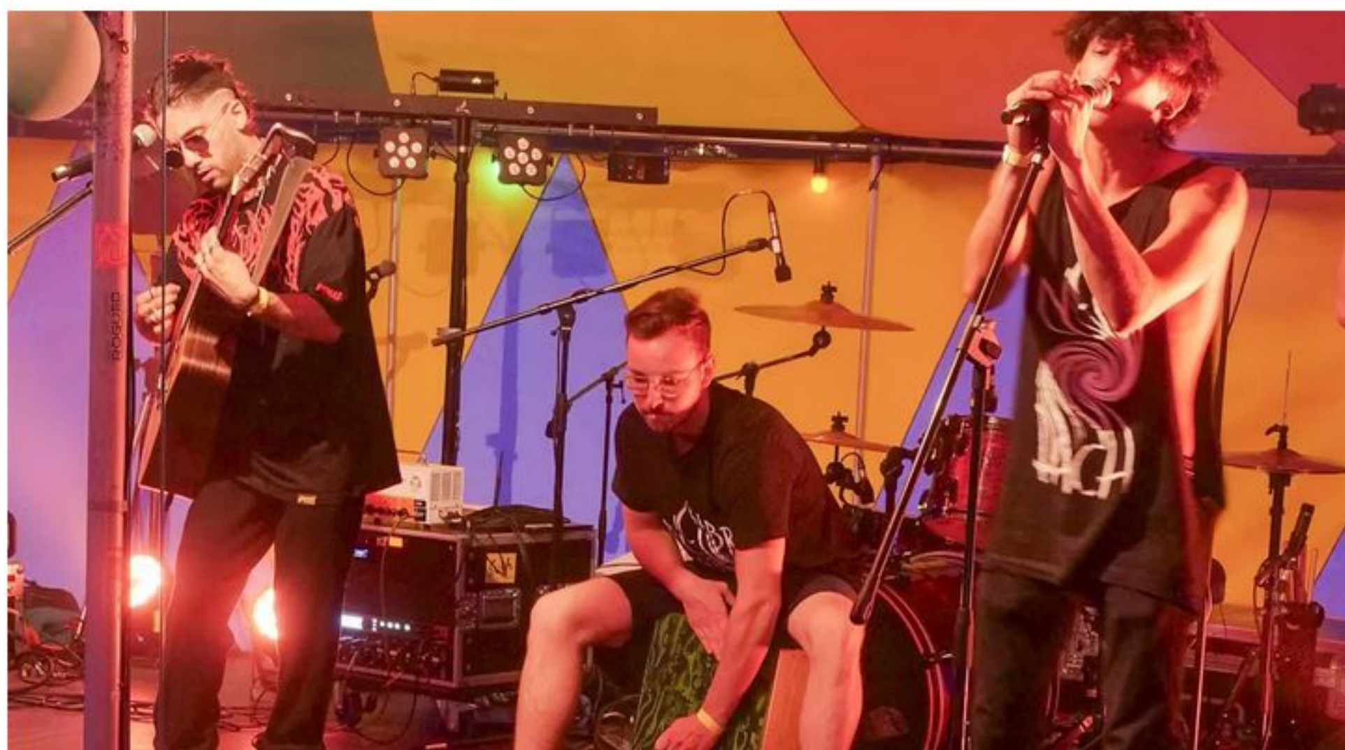
Beim Jubiläum mit von der Partie: die Band Nachbardach, hier bei einem Auftritt dieses Jahr beim Ditzinger Zeltcafé.

Der Jugendhausverein Leonberg wird 50 Jahre alt. Gefeierte wird mit einer ausgedehnten Festwoche, die an diesem Freitag beginnt. Veranstaltungen und Konzerte gibt's in der Beat Baracke und im Treff Warmbronn.